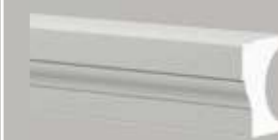
472111 HALVE BALUSTRADE- HANDLEUNING