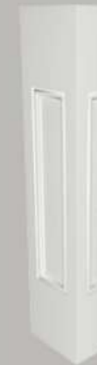
475111 HALVE BALUSTRADEPI- LAAR