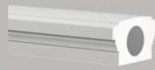
472101 BALUSTRADEHAND- LEUNING