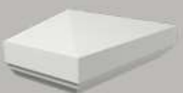
476211 HALF DEKSTUK VOOR BALUSTRADEDEEL PYRAMIDE