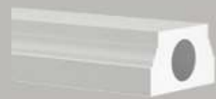
474101 BALUSTRADEGROND- STUK