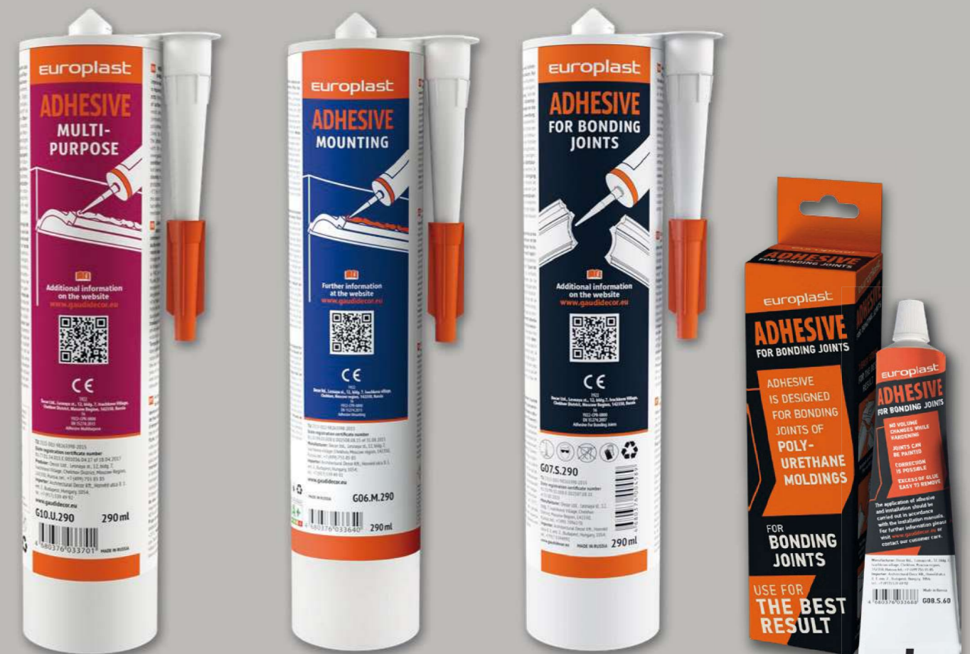
G10U.290 290 ml

Volg de handleiding en gebruik bevestigingsgereedschappen en lijmen die door de fabrikant worden aanbevolen: bij de bevestiging gebruikt u Profhome veelzijdige lijm, voor het verlijmen van voegen gebruikt Profhome-lijm voor het verlijmen van voegen.“