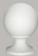
477101 BOLVORMIG BALUSTRADEDEKSTUK