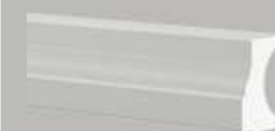
474111 HALF BALUSTRADE- GRONDSTUK