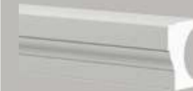
472111 HALVE BALUSTRADE- HANDLEUNING